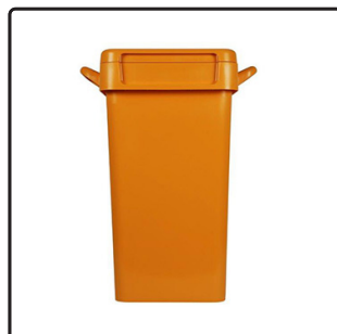
Cestino Multiuso con Manici