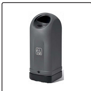
Cestino Multiuso Design