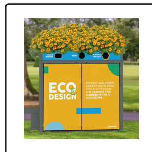
Mini Isola con Fioriera